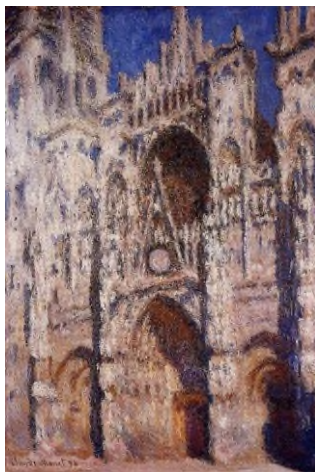
Клод Моне «Собор в Руане в солнце». Музей Орсе, Париж. 1894

- 1880е – задается целью буквально остановить мгновение – важной вехой в его творчестве становится многократное изображение Руанского собора – в нем мотив теряет свое самостоятельное значение, превращаясь в повод для передачи изменчивости жизни света. При это свет становится главным мотивом уже не одной картины, а большего цикла.