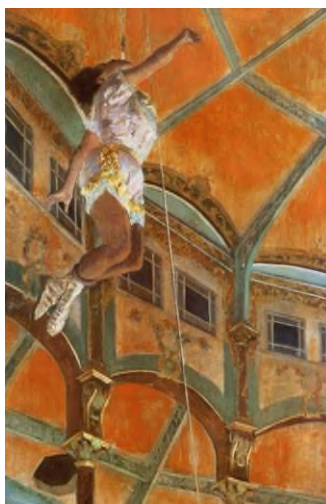
Эдгар Дега «Мисс Лала в цирке Фернандо». Национальная портретная галерея, Лондон. 1979

В отличие от более ранних реалистов, импрессионисты больше концентрировались на том, как свет воздействовал на ландшафт в определенный момент времени, а не создавали точное представление статичной сцены. Их методы, предметы и цветовые палитры вступали бы в конфликт с принятыми в искусстве параметрами для своей эпохи, что требовало отказа от ограничительного контроля таких учреждений, как Académie des Beaux-Arts которые традиционно устанавливали стандарты в парижском мире искусства.