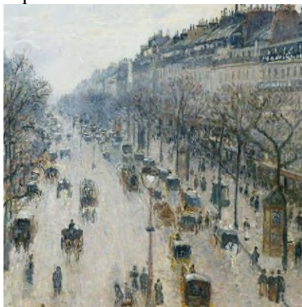
Камиль Писсарро «Бульвар Монмартр. Утро, облачная погода». Национальная галерея Виктории, Мельбурн. 1897

- в 1890е возвращается к прежней манере, позднее творчество – это городские пейзажи, в сущности, это также серии.